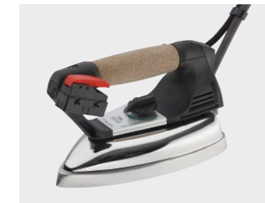
Ferro da stiro mod. EOS PRO (fornito standard) EOS PRO iron (standard equipment)

Braccio inox Braccio stiro aspirante Kit pistola aria/vapore Kit pistola vapore Kit secondo ferro (ferro escluso) Kit soffiaggio su braccio Kit spazzola vapore Poggia ferro girevole Reggifilo a bilanciare Reggifilo a bilanciare con luce Kit doppia pedaliera per lo stiro su entrambi i lati